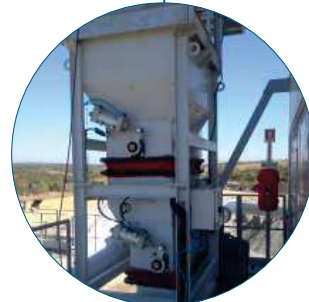
Waiting hopper / Trémie d'attente (Mixer RAP)